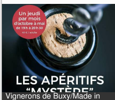
LES APÉRITIFS "MYSTÈRE" Vignerons de Buxy/Made in

2 Route de Chalon BUXY 03 85 92 03 03 accueil@vigneronsdebuxy.fr