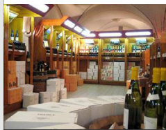
Vignerons de Buxy Caveau de

1, route de Curtil SAINT-GENGOUX-LE- NATIONAL 03 85 92 61 75 saint-gengoux@vigneronsdebuxy.fr