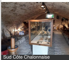
Sud Côte Chalonnaise

Le Bourg BUXY 03 85 92 00 16 tourisme@ccscc.fr