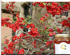
Domaine Croix de la fleur

Rue de la Croix de la Fleur BISSY-SUR-FLEY 06 74 85 13 26 dom.croixlafleur@gmail.com