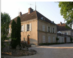
Maison Albert Sounit

5, place du Champ de Foire RULLY 03 85 87 20 71 info@albert-sounit.fr