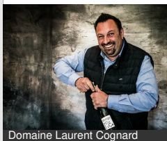
Domaine Laurent Cognard

4, ruelle de la pompe BUXY 09 88 08 20 20 06 85 13 91 35 contact@domainecognard.fr