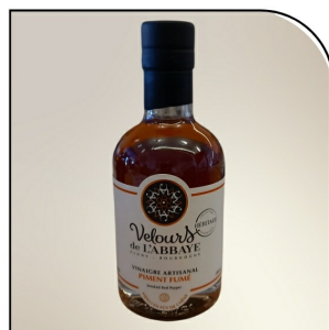
PIMENT FUMÉ Vinaigre piment fumé Navour sur Grosne, 200ml