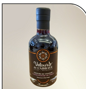
CASSIS POIVRE DE TIMUT Velours de vinaigre Navour sur Grosne, 200ml