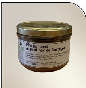
PÂTÉ PUR BŒUF PINOT NOIR DE BOURGOGNE Gaec PARDON Tramayes, 180g