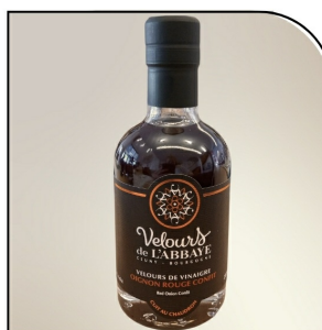
OIGNON ROUGE CONFIT Velours de vinaigre Navour sur Grosne, 200ml