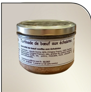
TARTINADE DE BŒUF AUX ÉCHALOTES Gaec PARDON Tramayes, 180g