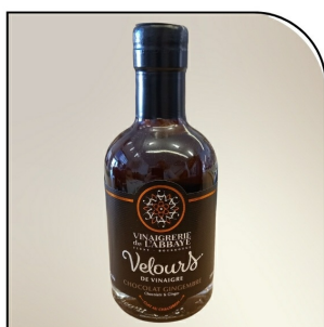
CHOCOLAT GINGEMBRE Velours de vinaigre Navour sur Grosne, 200ml