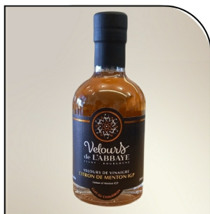
CITRON DE MENTON Velours de vinaigre Navour sur Grosne, 200ml