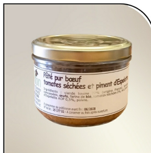
PÂTÉ PUR BŒUF TOMATES SÉCHÉES ET PIMENT D'ESPELETTE Gaec PARDON Tramayes, 180g