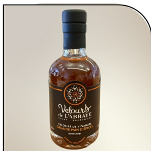
ORANGE PAIN D'ÉPICES Velours de vinaigre Navour sur Grosne, 200ml