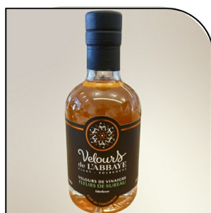
FLEURS DE SUREAU Velours de vinaigre Navour sur Grosne, 200ml