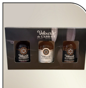
COFFRET 3 SAVEURS Vinaigre et/ou velours Navour sur Grosne, 3x50ml

Choix parmi les 9 parfums évoqués sur cette page plus : bergamote galanda, baies rouges et ail vert fumé