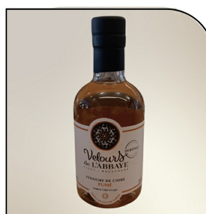
FUMÉ Vinaigre de cidre fumé Navour sur Grosne, 200ml