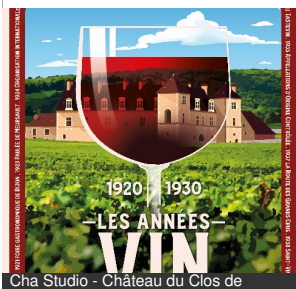
Cha Studio - Château du Clos de Vougeot

Ouvert du 05/04/2024 au 31/10/2024 de 9h30 à 18h00. Fermeture de la billetterie à 17h30. Les samedis, le Château ferme à 17h00 et la billetterie à 16h30., 2024