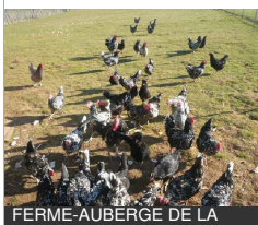
FERME-AUBERGE DE LA RUCHOTTE

La Ruchotte 21360 BLIGNY-SUR-OUCHE Tél : 03 80 20 04 79 lafermedelaruchotte.com , http