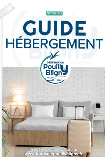
● GUIDE HÉBERGEMENT

Afin de profiter pleinement de votre séjour sur notre Destination Pouilly-Bligny , nous vous invitons à consulter et/ou télécharger les éditions de notre collection 2025, comme le Guide Hébergement ou encore le Guide Découverte.