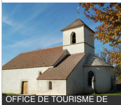
OFFICE DE TOURISME DE MONTCEAU-ET-ECHARNANT

Hameau d'Echarnant Grande Rue 21360 MONTCEAU-ET- ECHARNANT Tél : 03 80 20 24 93