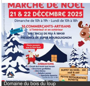
Domaine du bois du loup

21/12/2025 au 22/12/2025 de 10h00 à 18h00