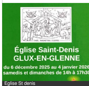
Eglise St denis