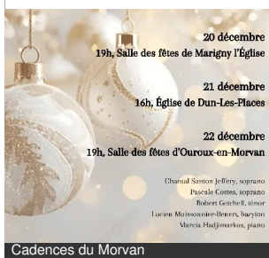
Cadences du Morvan