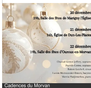
Cadences du Morvan