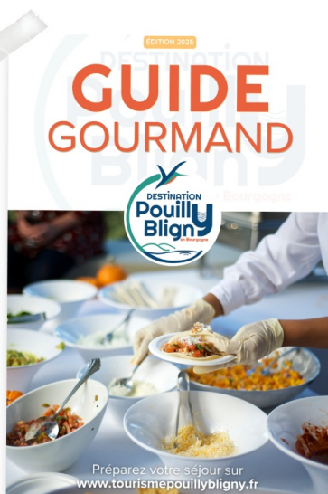
● GUIDE GOURMAND

Afin de profiter pleinement de votre séjour sur notre Destination Pouilly-Bligny , nous vous invitons à consulter et/ou télécharger les éditions de notre collection 2025, comme le Guide Gourmand ou encore le Guide Découverte.