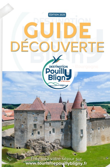
● GUIDE DÉCOUVERTE