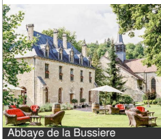
Abbaye de la Bussière

19 Rue de Saint-Aubin 21360 LA BUSSIÈRE-SUR-OUCHE Tél : 03 80 49 02 29, 03 80 49 02 29 abbayedelabussiere.fr