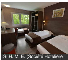
S. H. M. E. (Société Hôtelière)

10, Les Portes de Bourgogne 21320 CREANCEY Tél : 03 80 90 82 34 http://hotelduvalvert.com , http