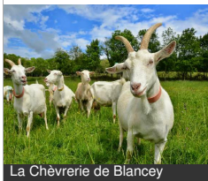
La Chèvrerie de Blancey

Petite rue haute de l'église 21320 BLANCEY Tél : 06 89 09 38 55 lebiquet.blogspot.com