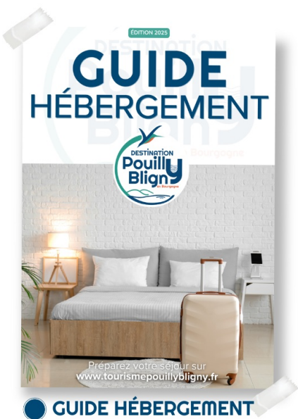
● GUIDE HÉBERGEMENT

Afin de profiter pleinement de votre séjour sur notre Destination Pouilly-Bligny , nous vous invitons à consulter et/ou télécharger les éditions de notre collection 2025, comme le Guide Hébergement ou encore le Guide Découverte.