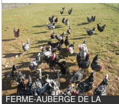
FERME-AUBERGE DE LA RUCHOTTE

La Ruchotte 21360 BIGNY-SUR-OUCHE Tél : 03 80 20 04 79 lafermedelaruchotte.com , http