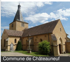
Commune de Châteauneuf

Rue de l'Église 21320 CHATEAUNEUF Tél : 03 80 49 21 64 chateauneuf-cotedor.fr