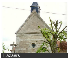
Rue du Centre 21320 MARCILLY-OGNY Tél : 09 66 95 31 88

Chapelle XVIIIe Saint-Guillaume d'Aquitaine, reconstruite au XIXe suite à un incendie.