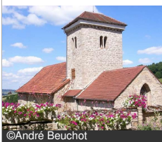
Grande Rue 21320 MARTROIS Tél : 03 80 90 88 88

L'église romane paroissiale de la Nativité des XII-XIIIe siècles, retouchée aux XV-XVIIIe siècles, fut décorée de peintures murales au XIXe siècle. Les autels latéraux remontent au XVII-XVIIIe siècle. Devant le porche d'entrée, on remarque un imposant bénitier hexagonal, tandis qu'une belle croix...