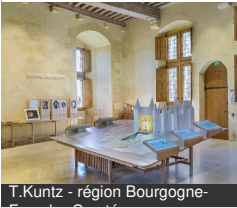
T.Kuntz - région Bourgogne-

Grande rue 21320 CHATEAUNEUF Tél : 03 80 49 21 89 chateauneuf.bourgognefrancecomte.eu