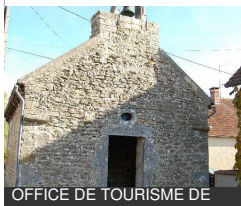
Hameau de Grandmont 21360 MONTCEAU-ET- ECHARNANT Tél : 03 80 20 24 93

Au cœur du hameau, une chapelle dont l'intérieur est décoré de pierres percées, a été construite vers 1640. Dans cette chapelle, on voit une grotte de Lourdes en rocaille de la fin du XIXe siècle, avec, placée à l'intérieur, une statue de la Vierge. Vous pourrez remarquer le parement en bois de...