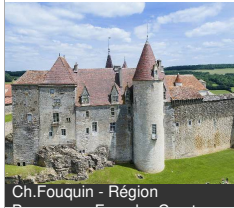
Ch.Fouquin - Région

Grande rue 21320 CHATEAUNEUF Tél : 03 80 49 21 89 chateauneuf.bourgognefrancecomte.eu