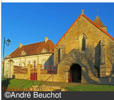
Impasse de l'église 21320 MARCILLY-OGNY Tél : 09 66 95 31 88

L'église paroissiale Saint-Germain de Marcilly remonte au XIIIe. Elle fut modifiée au XVIIIe, période durant laquelle on ajouta un porche couvert en laves, puis au XIXe. En observant bien, on remarque une corniche bourguignonne, plusieurs petites têtes sculptées et que l'édifice semble brisé entre...