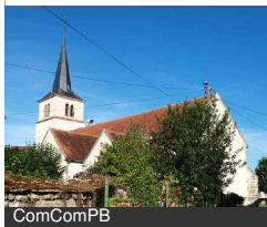
Impasse de l'église 21320 MACONGE Tél : 03 80 90 74 60

Le clocher porche XIXe de l'église paroissiale Sainte-Anne XV-XVIe, anciennement Saint-Gengoux, supporte une flèche octogonale en ardoises. L'intérieur recèle des boiseries, une chaire à prêcher et un confessionnal XIXe. Un bas-relief de la Cène décore le maître-autel en pierre, également du XIXe.