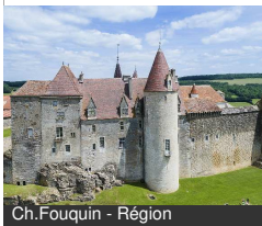
Ch.Fouquin - Région

Grande rue 21320 CHATEAUNEUF Tél : 03 80 49 21 89 chateauneuf.bourgognefrancecomte.eu