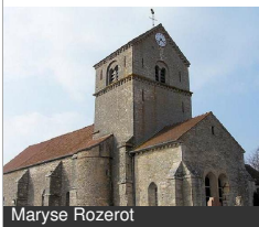
Rue du Gué d'Amont 21360 MONTCEAU-ET- ECHARNANT Tél : 03 80 20 24 93

L'église paroissiale Saint-Vincent de Montceau remonte au XII ou XIIIe, mais fut sérieusement remaniée au gré des siècles. Couverte de petites tuiles, elle garde les traces de son ancienne toiture en laves sur un côté de la tour carrée du clocher. Cette tour est surmontée d'une toiture en bâtière...